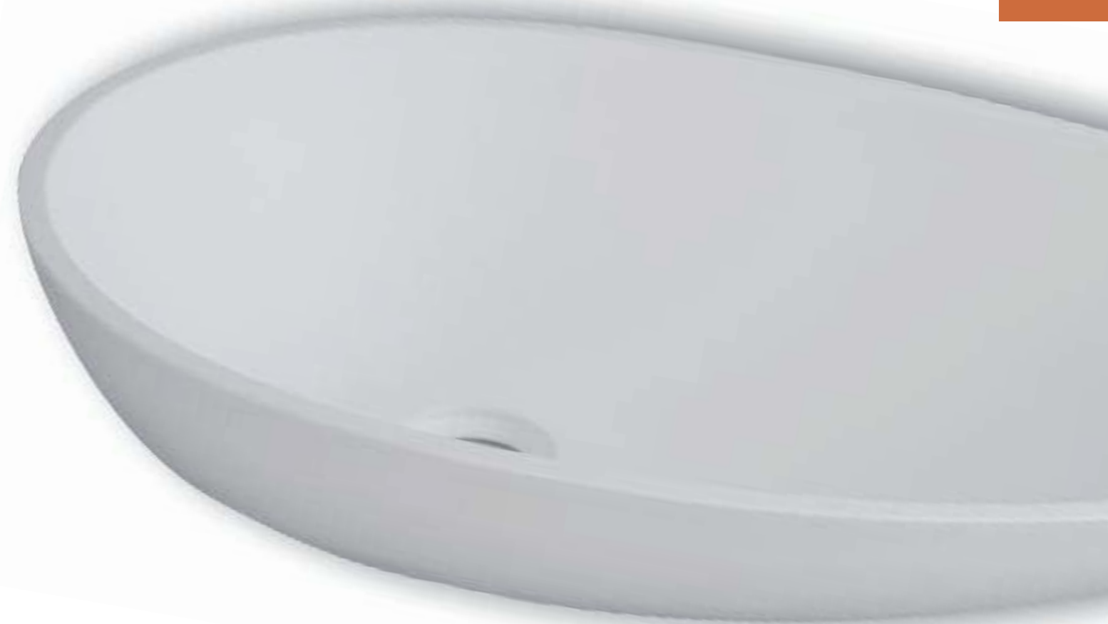
lavabo da appoggio in Dupont™ Corian® colore Glacier White spessore mm 12,3 dimensioni mm 600 X 400 X 120 h finitura satinata; senza troppo pieno; piletta non inclusa