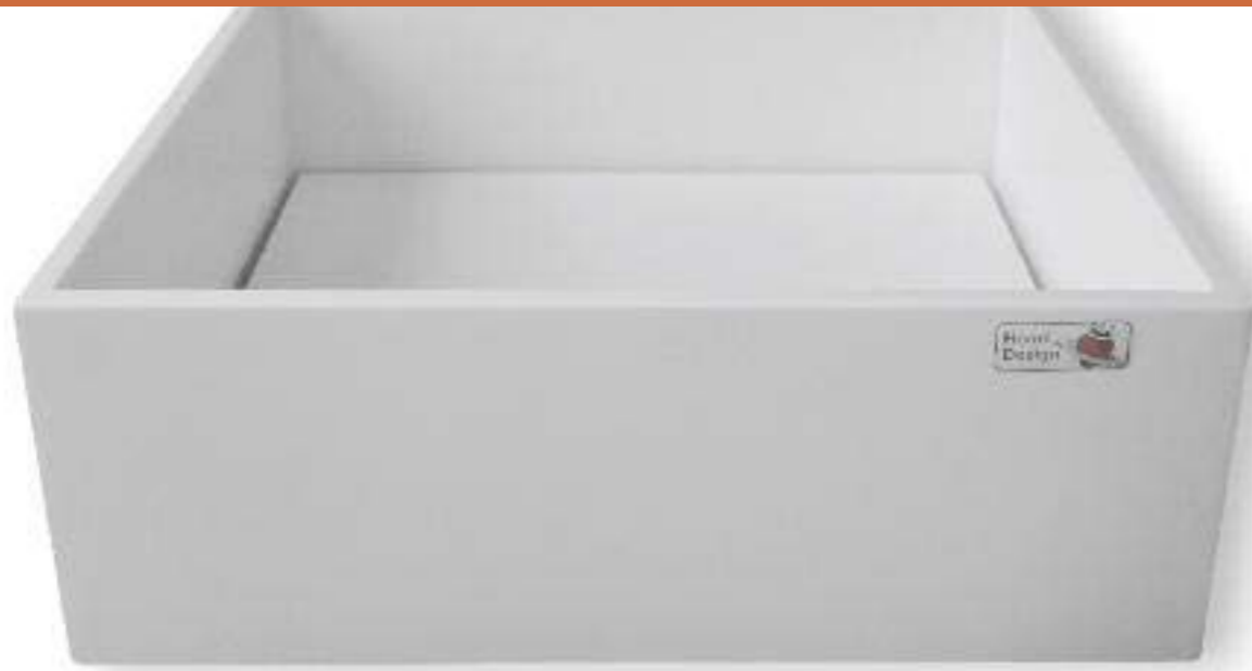
lavabo da appoggio in Acrylic Solid Surface bianco spessore mm 12,3 dimensioni mm 380 X 380 X 140 h; profondità vasca mm 120 fondo vasca termoformato per favorire il deflusso dell'acqua possibile fondello copri piletta; finitura satinata senza troppo pieno; piletta non inclusa