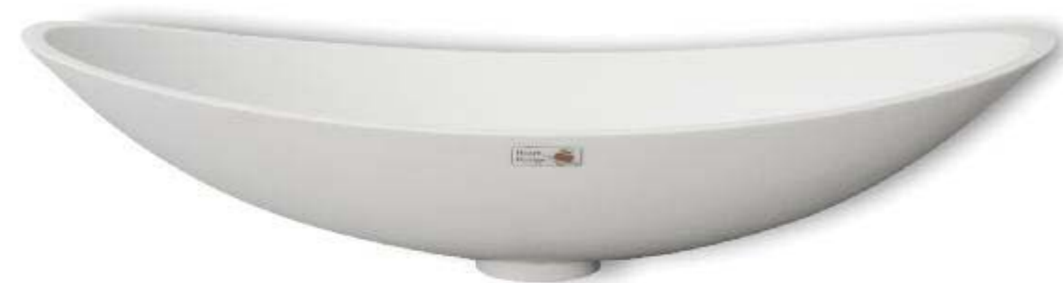
lavabo da appoggio in Dupont™ Corian® colore Glacier White spessore mm 12,3 dimensioni mm 730 X 355 X 180 h installazione con attacchi idrici e scarico a muro finitura satinata; senza troppo pieno; piletta non inclusa