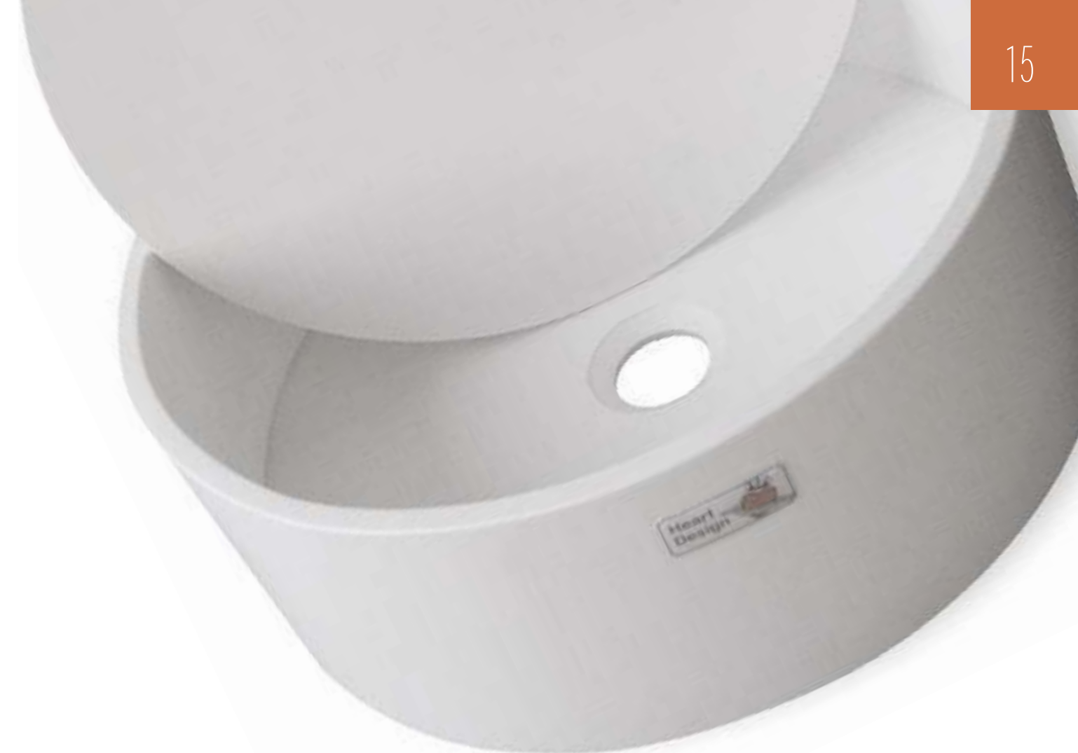
lavabo da appoggio in Acrylic Solid Surface bianco spessore mm 12,3 dimensioni: diametro da mm 350 a 500 X 140 h profondità vasca mm 120; fondo vasca termoformato per favorire il deflusso dell'acqua possibile fondello copri piletta finitura satinata senza troppo pieno piletta non inclusa